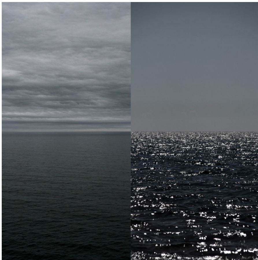
MEER 17 Foto-Abzug / Acrylglas 100 x 100 cm, 2011