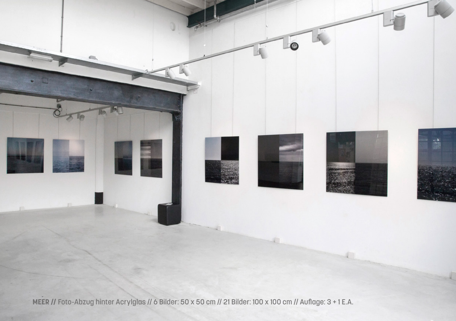
MEER // Foto-Abzug hinter Acrylglas // 6 Bilder: 50 x 50 cm // 21 Bilder: 100 x 100 cm // Auflage: 3 + 1 E.A.