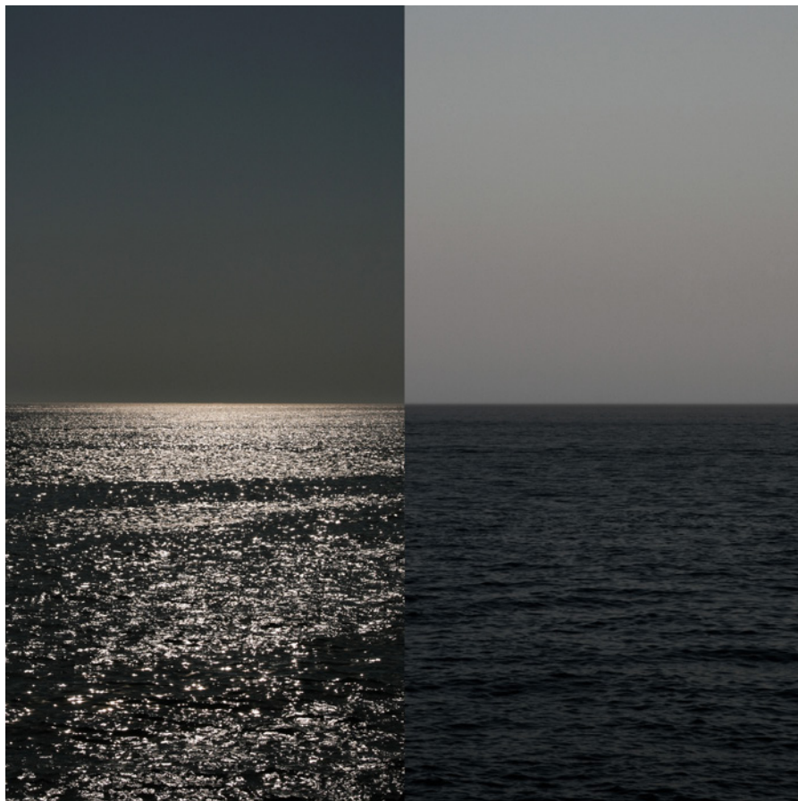
MEER 13 Foto-Abzug / Acrylglas 100 x 100 cm, 2011