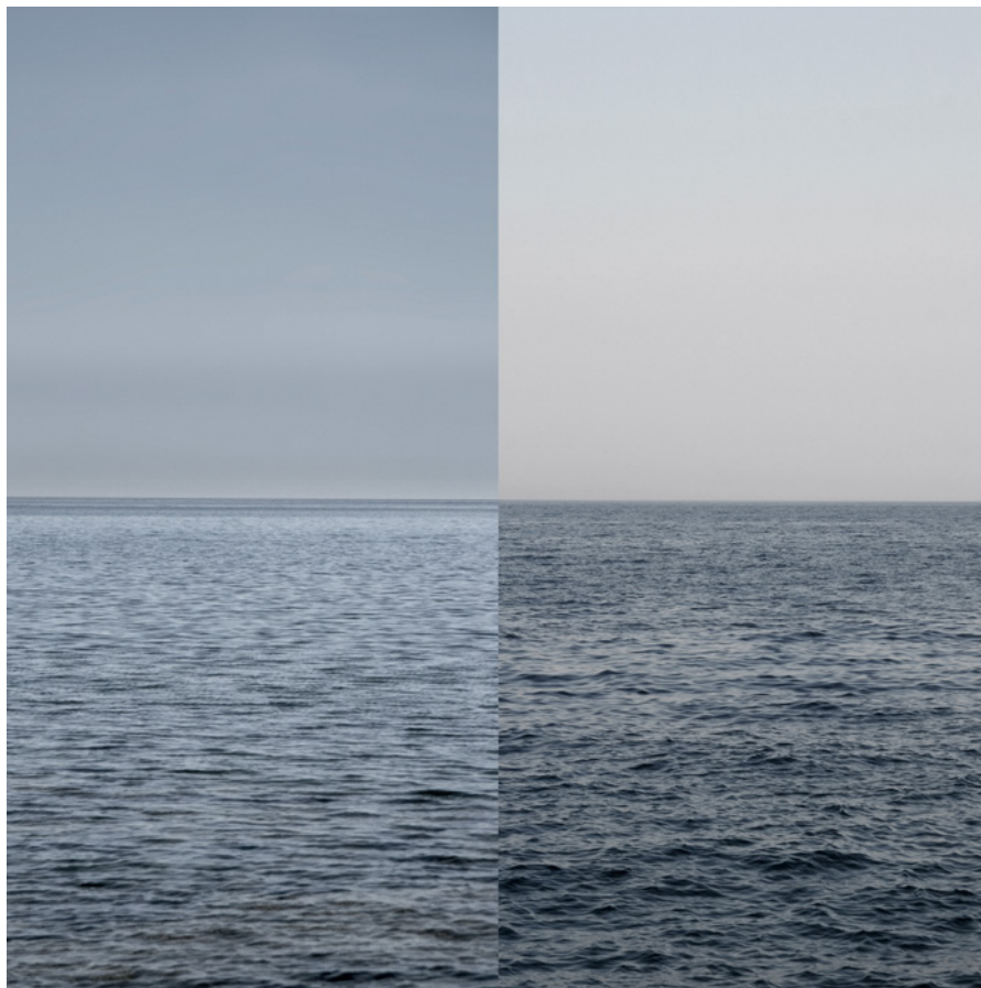
MEER 11 Foto-Abzug / Acrylglas 100 x 100 cm, 2011