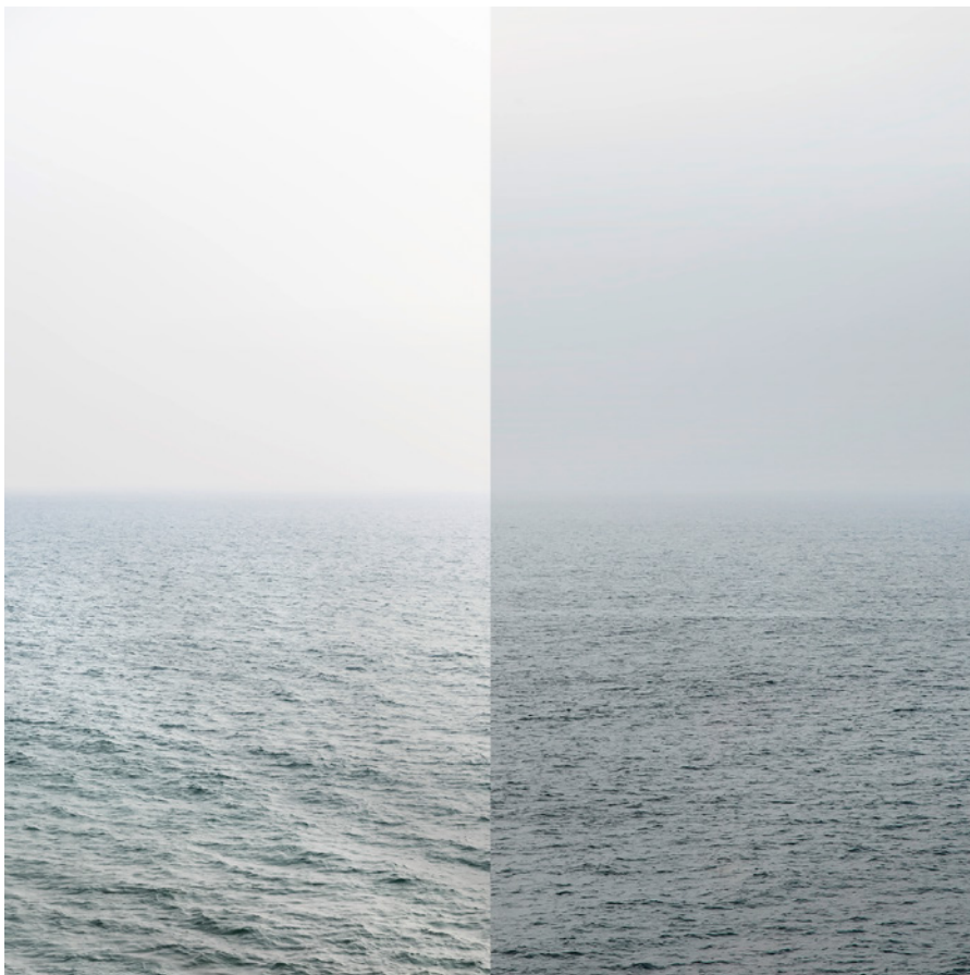
MEER 23 Foto-Abzug / Acrylglas 100 x 100 cm, 2013