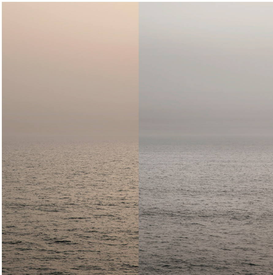
MEER 24 Foto-Abzug / Acrylglas 100 x 100 cm, 2013