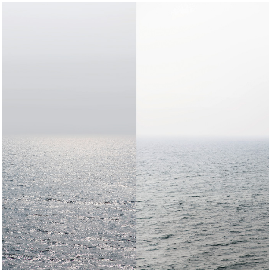
MEER 27 Foto-Abzug / Acrylglas 100 x 100 cm, 2013