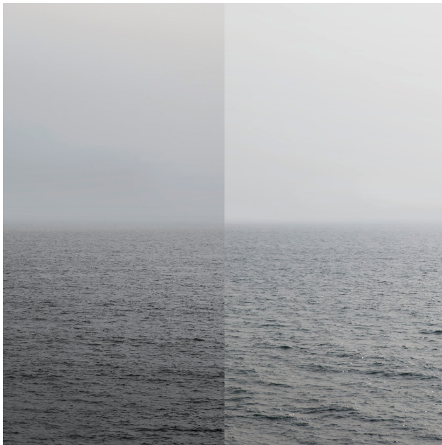
MEER 22 Foto-Abzug / Acrylglas 100 x 100 cm, 2013