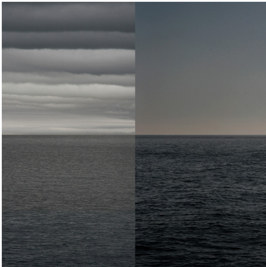
MEER 18 Foto-Abzug / Acrylglas 100 x 100 cm, 2011