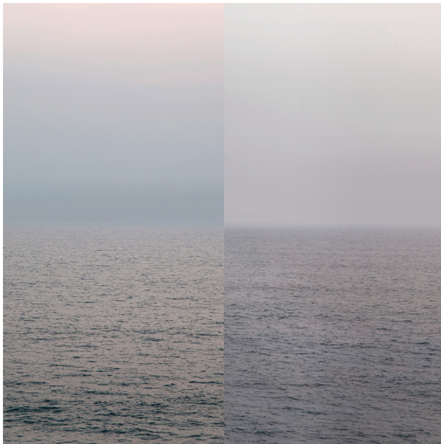
MEER 26 Foto-Abzug / Acrylglas 100 x 100 cm, 2013