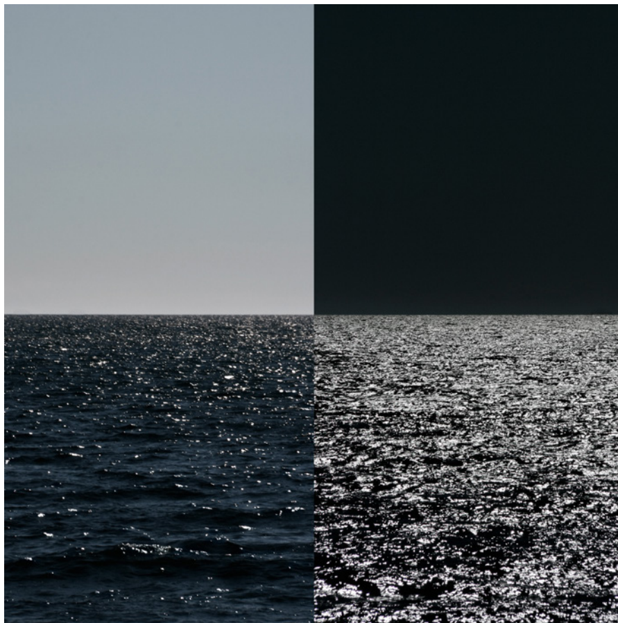
MEER 15 Foto-Abzug / Acrylglas 100 x 100 cm, 2011